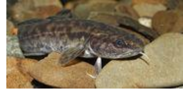
Adulte Quappe

Die Quappe ( Lota lota L. ) ist ein dorschartiger Süßwasserfisch, der einst deutschlandweit in Fließ- und Stillgewässern verbreitet war und in Flüssen auf intakte Auen angewiesen ist. Heute sind die Bestände der Quappe in mehreren Bundesländern gefährdet, in Nordrhein-Westfalen ist die Art vom Aussterben bedroht. Mit den Maßnahmen im Projekt „Die Quappe im Rheingebiet – ein verborgener Fisch kehrt in Fluss und Stillwasser zurück“ sollen die Bestände nun stabilisiert und gefördert werden.