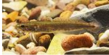
Jungquappe, ca. 3 Monate alt